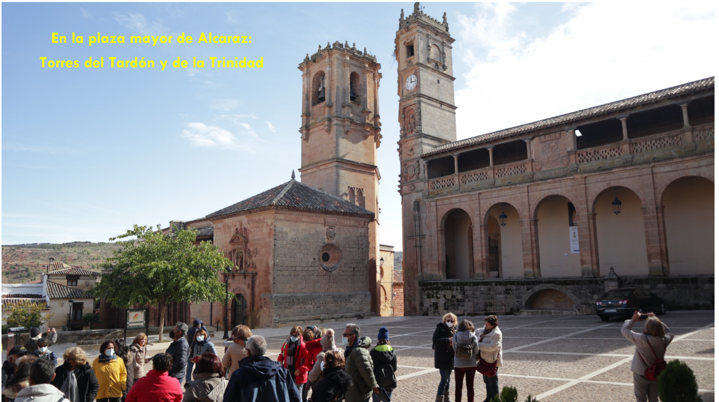
En la plaza mayor de Alcaraz: Torres del Tardón y de la Trinidad